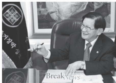
Der „versprochene Pastor“ Lee, Man-Hee.

zehntausenden von zehntausenden. (‘The founder of a church, the Counselor, and holy spirits’ 2008, Healing All Nations website, http://healingallnations.shinchonji.kr/archives/tag/church-of-jesus )