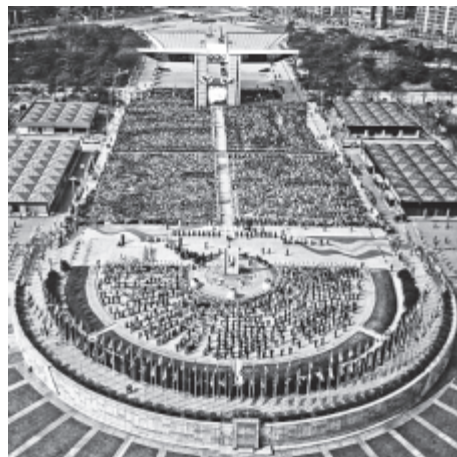
Massenveranstaltung der WMS, Internetwerbung der Gruppe, Foto: Archiv Gandow

Loyalitätsdruck. Schwerwiegend ist auch die gelehrte Angst vor dem Verlassen der Gruppe.